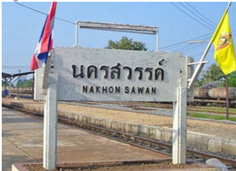
เมืองสี่แคว แห่มังกร พักผ่อนบึงบอระเพ็ด ปลารสเด็ดปากน้ำโพ