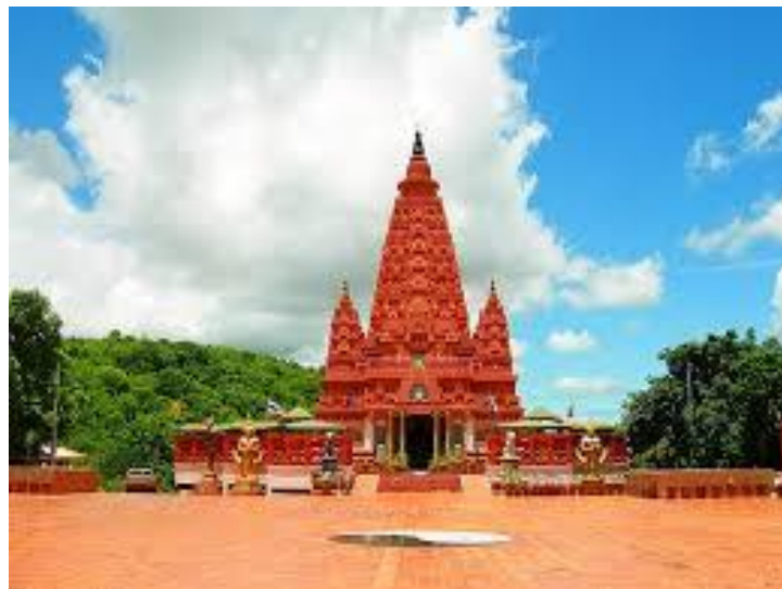
วัดป่าสิริวัฒนวิสุทธิ์

อาคารมีลักษณะเป็นรูปเรือกระแซง หรือเรือเอี่ยมจุ่น ซึ่งเป็นเรือบรรทุกสินค้าในแม่น้ำเจ้าพระยาในอดีต