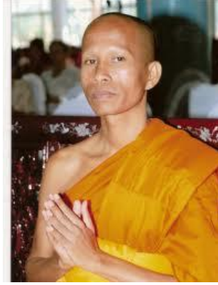
พระราชปัญญาเวที เจ้าอาวาสวัดตากฟ้า พระอารามหลวง รongเจ้าคณะภาค ๔